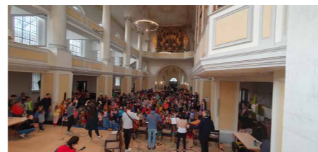
Feierzeit-Band: Zum Höhepunkt der Veranstaltung, der Feierzeit, spielte die Band stimmungsvolle Lieder zum Singen und Tanzen.

zu beeindruckenden Spendenmengen. Der Höhepunkt der Veranstaltung wurde durch weihnachtliche Mitsing- und Tanzlieder der Band erreicht. Inmitten der festlichen Atmosphäre wurde die Botschaft verkündet, dass Jesus Christus das größte Geschenk für die Menschen ist. Die Veranstaltung endete mit einem kostenlosen Mittagessen für alle Gäste.