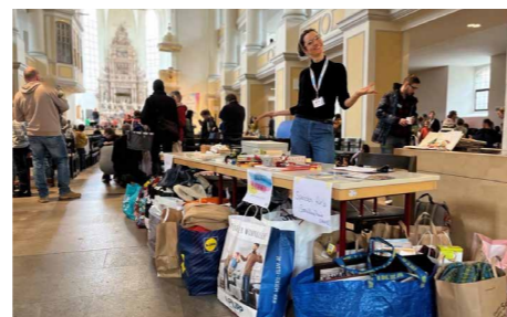
Spendenaktion-Echt-Herzlich: Bei der Spendenaktion für das Sozialkaufhaus "Echt herzlich" sind beeindruckend viele Spielsachen und Kleidungsstücke gesammelt worden.