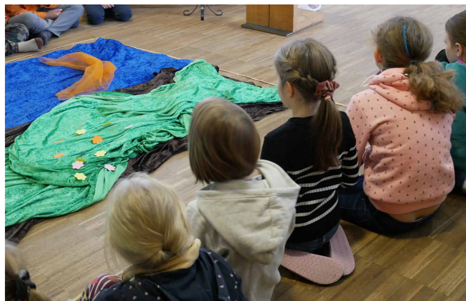
Ein Bodenbild erzählte die Geschichte von Gottes Schöpfung.